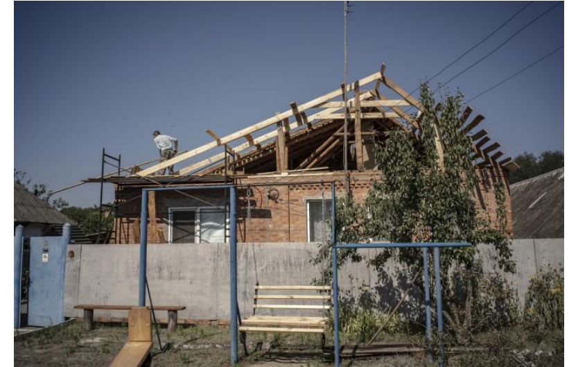
Proposal an REPIC: Gebäudereparatur / Academy mit Caritas-SPES und EBP