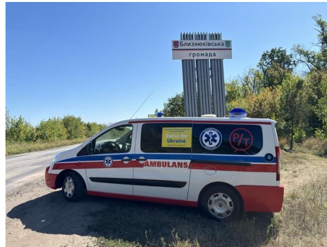
Feuerwehrfahrzeuge und Ambulanzen