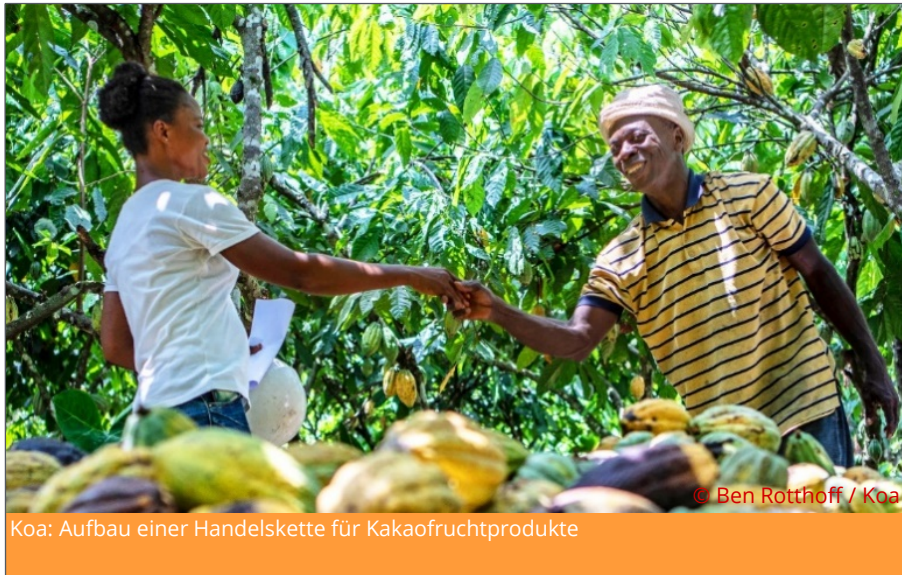
Koa: Aufbau einer Handelskette für Kakaofrüchtprodukte