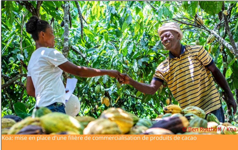
Koa: mise en place d'une filière de commercialisation de produits de cacao